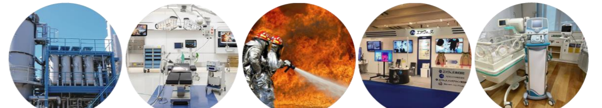
工場見学 医療教育用コンテンツ 防災訓練 オンライン展示会 機器の操作研修 etc...